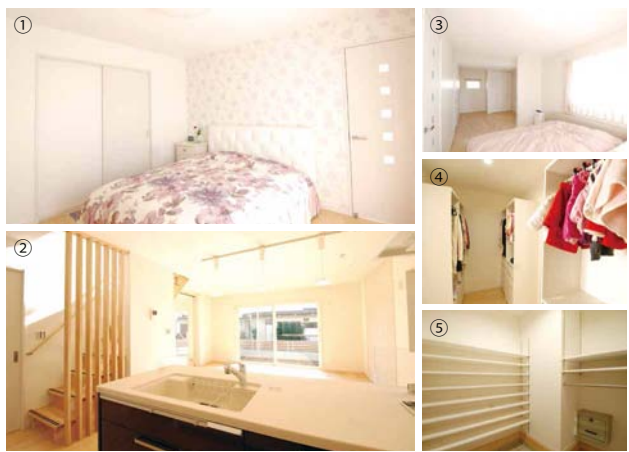
①奥さまのセンスが光る主寝室 ②オープンキッチン ③将来は2部屋にできる子ども部屋 ④ウォークインクローゼット ⑤シューズクローゼット。郵便受けが室内にあるのがいい! ※②⑤は引越前に撮影

れて、さまざまな提案をくださったのがよかったですね。家事や生活の動線を考えた提案には、なるほどと感心しました。おかげさまで不安を感じることがもなく、無事完成しました。これから庭づくりが待っています、のんびり数カ月かけてつくっていきましょうと思っています。