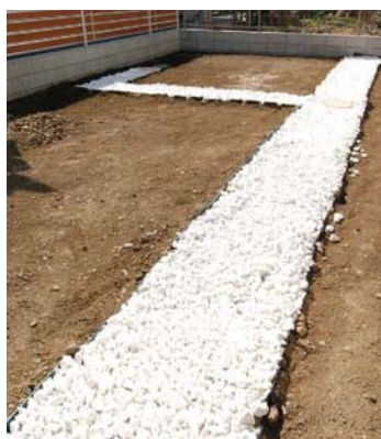
広いお庭の完成が待ち遠しい!