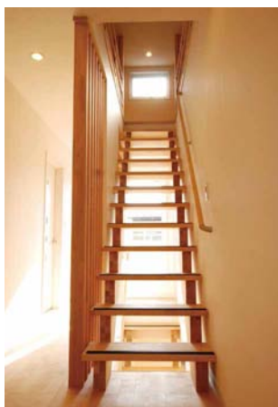
ストリップ階段が光と風を運びます

●木村建築に決めたのはなぜですか。 ——木村建築さんはハウス会から紹介してもらったのですが、決め手は接着剤をできるだけ使わないということです。家族の健康を一番に考えたいと思います。木村建築さんに決めました。