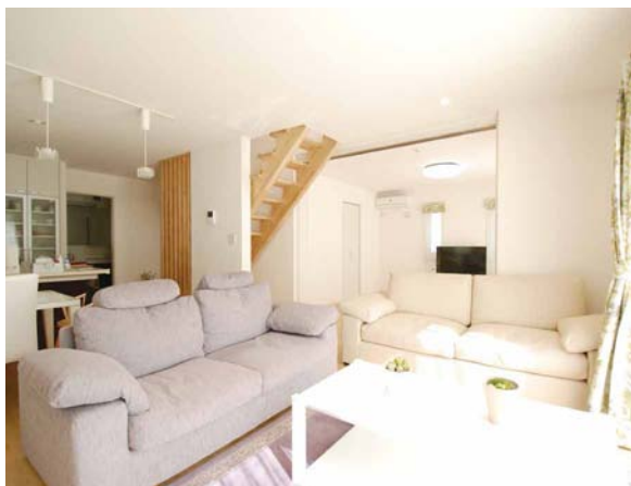
明るい光が差し込むLDKは洋室と合わせて28帖!

●マイホームを建てようと思ったきっかけを教えてください。 ——以前は賃貸の一戸建てで暮らしていたのですが、子どもと一緒に土いじりをしてみたいという希望があって、庭のある家に住みたいと考えていました。当時住んでいた家の近くに藤和ハウスさんの分譲地があって、そこに行ってみたのが藤和ハウスさんとの出会いですね。建売